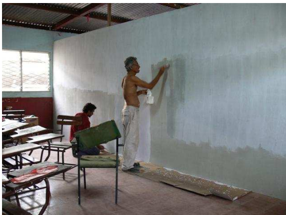
de eerste wand staat er weer.