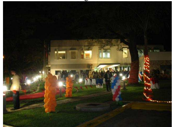
Nederlandse Ambassade te Managua

Op 27 april waren we uitgenodigd op de Nederlandse Ambassade om Koninginnedag te vieren. Bij tropische temperaturen luisteren naar het Wilhelmus en een toespraak van de Ambassadeur en daarna haring met roggebrood en allerlei andere Nederlandse gerechten. Zelfs de muziek was puur Nederlands. Wat dacht je van bewegen op muziek van Andre Hazes. De Nicaraguanen vonden de Nederlandse folklore maar zo, zo en gingen later wel uit hun bol met de salsa en "Flor de Cagna".