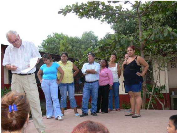
Achter mij de gekozen ouderaad.