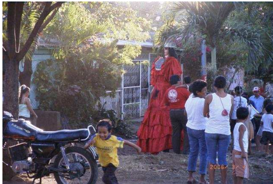
Folklore in de wijk. Een manier om geld te verdienen.