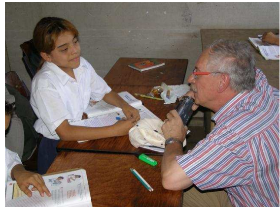
Engelse les in groep 4.