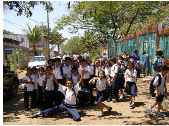
Einde van de lessen van de ochtendgroep.

Op eigen initiatief is het schoolbestuur dit schooljaar begonnen met voortgezet onderwijs voor 12 tot 16 jarigen. Het bestuur van de stichting Salto Adelante was hier nog niet van op de hoogte. We ondersteunen dit eigen initiatief echter van harte. Het geeft aan dat de barrio onderwijs voor hun kinderen belangrijk vind.