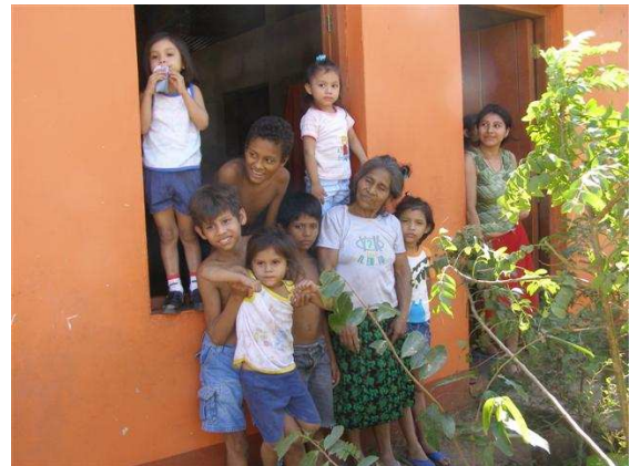
Oma en enkele van haar wegwerpkinderen voor het weeshuis.

De laatste anderhalve week heb ik met allerlei groeperingen en personen onderhandelingen gevoerd over de voortgang van ons project. Uiteraard is er ook gesproken over nieuwe projecten die de wijk en het schoolbestuur het komend jaar graag willen uitvoeren. Centraal hierin staat de "Casa Communal" met de medische post. We wachten nog op de goedkeuring van de gemeente en de definitieve begroting. Daarna kan de verdubbeling aangevraagd worden bij de LBSNN en kan het project starten.