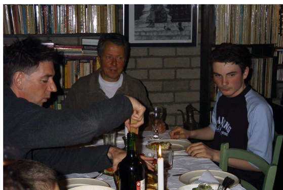
Het eten was hartstikke lekker

In de krant van zaterdag 5 april staat het eerste verslag over onze komende reis.